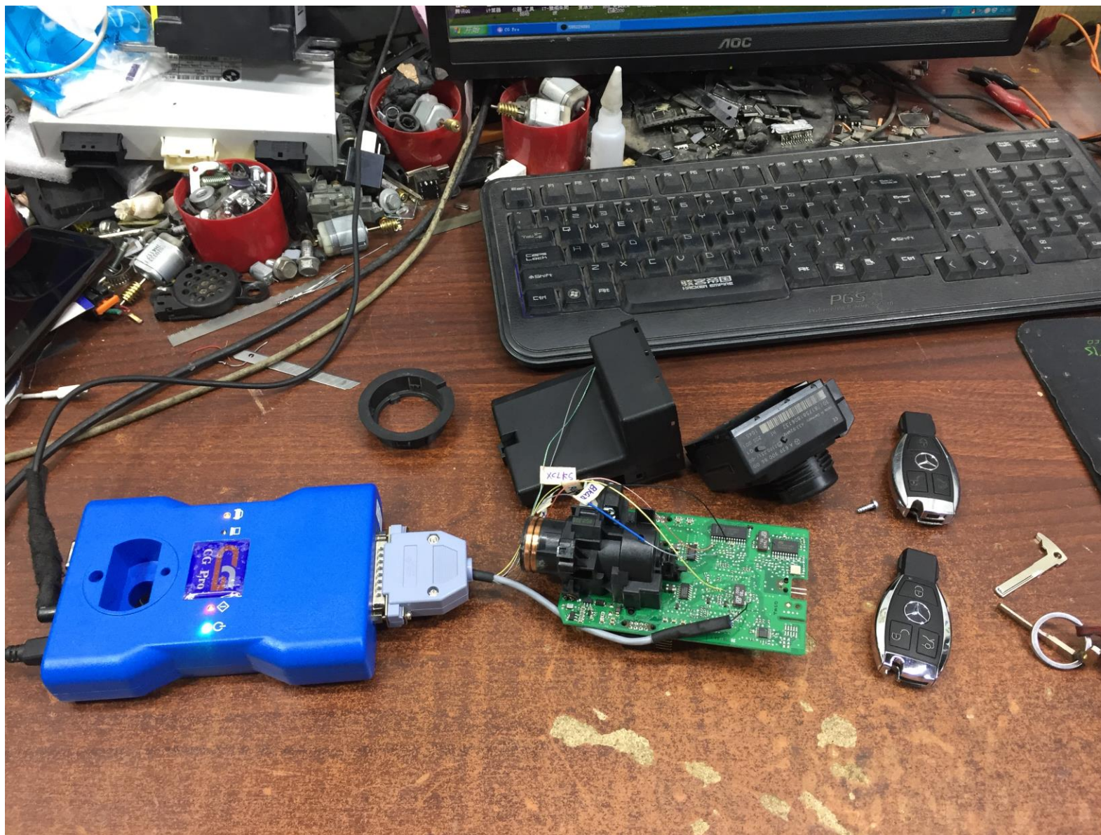
3.打开软件，根据接线图接线，进行数据读取