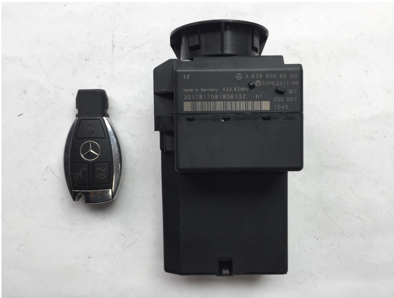
2.车辆熄火，拆取锁头模块，查看外观样式和芯片